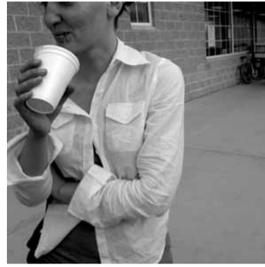
Mitglied der Fyilmklasse von 2003–2009 lebt und arbeitet in Berlin

Das Bild stellt zwei im Gebüsch stehende Landebahnlampen dar. Sie haben ihre Funktion verloren und existieren zwecklos in der Stadtlandschaft als Erinnerungstücke / Objekte aus der Vergangenheit.