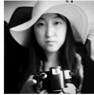
Mitglied der Fyilmklasse seit 2008 lebt und arbeitet in Münster

Weil ich in Deutschland als Ausländerin lebe, war es mir oft unangenehm Bankgeschäfte abzuwickeln. Ich hatte immer Angst davor, mit deutschen Angestellten in Kontakt zu treten. Obwohl ich jetzt seit fünf Jahren hier wohne, macht es mir immer noch Angst, Verständigungsprobleme wegen Bankangelegenheiten oder Ähnlichem zu bekommen und diese alleine lösen zu müssen.