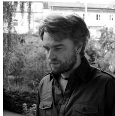
Mitglied der Fyilmklasse seit 2008 lebt und arbeitet in Münster