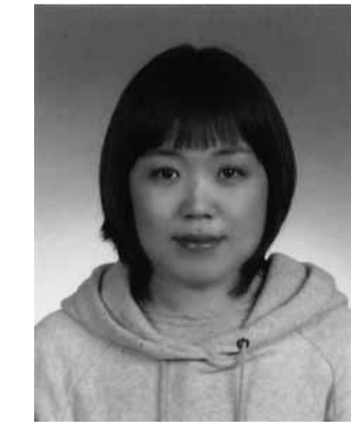
Mitglied der Fyilmklasse seit 2004 lebt und arbeitet in Düsseldorf