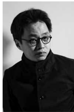
Mitglied der Fyilmklasse von 2000-2005 lebt und arbeitet in Seoul

"Voice of Silence" represents people, who live today with wounded hearts, as portraits on the beach. This project could give audiences some tips on how to cure it and proposes how they can recover the homogeneity of the "Others". This finally makes them understand what the wounded heart actually means, or what it is they are suffering from.