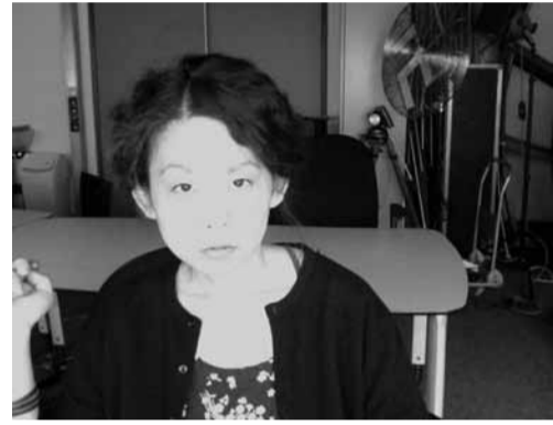
Mitglied der Fyilmklasse von 2003–2009 lebt und arbeitet in Münster und Seoul

Häufig sind Fotos gerahmt hinter Glas präsentiert. Auf der Oberfläche des gerahmten Bildes kann ein Betrachter dabei nicht nur das Bildnis der Fotografie, sondern auch das reflektierte Abbild des Ausstellungsraumes, Geschehnisse im Raum und seine eigene Reflexion sehen – "Seeing oneself while looking at image of art work."