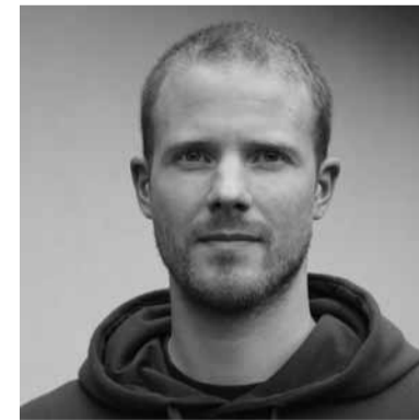
Mitglied der Fyilmklasse seit 2006 lebt und arbeitet in Münster und Telgte

Mit parallel mitlaufender Tonaufzeichnung gehe ich nachts durch das Gebäude der NRW.Bank und erstelle dabei an optisch und klanglich interessanten Orten Fotos. Bild und Ton wird anschließend am Computer synchronisiert, so dass der Rezipient der Videoarbeit am Monitor den Rundgang akustisch verfolgen kann. Bei jedem Geräusch des Auslösers wechselt das jeweilige Bild.