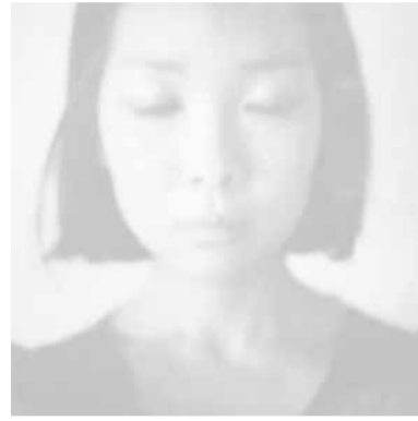
Mitglied der Fyilmklasse seit 2009 lebt und arbeitet in Münster

Ich fasziniere Traum und Unbewusstsein, die man in der Realität nicht sehen kann. Das Schlafen ist ein Prozess, der vom Bewusstsein zum Unbewusstsein übergeht. Und unerklärliche Symbole in Unbewusstsein helfen mir, meine vergessene Erinnerung und Wahrheit zu finden. Dies möchte ich auf dem Papier darstellen.