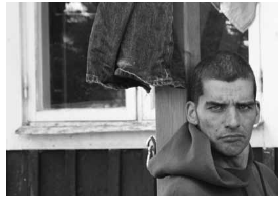
Mitglied der Fyilmklasse von 2003-2010 lebt und arbeitet in Hamburg

eine Andeutung von Wald in peripherer Brache eine Andeutung von Wildnis findend; und niemals heimwärts sein