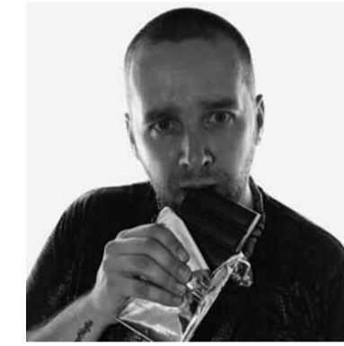
Mitglied der Fyilmklasse von 2006-2008 lebt und arbeitet in London

Choco is a work about choco bean trade in Africa, about slave work in 2010 year on cocoa bean farms for food plate for the biggest european companies, producing chocolate, kids in Africa don't know until now what is a chocolate. David Star is a work who connect jewish past time with now, hermetic close community who was changed from holocaust victim to make on ghettos and exterminate palestinians. Life behind wall... prisoners in on prison Fuck Love is in simple way work about love.