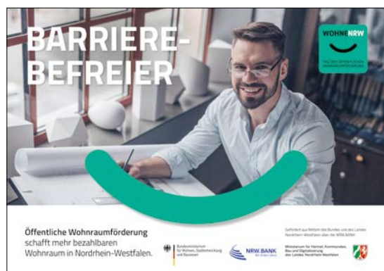
Mindestabbildungsgröße DIN-A2 (HxB): 420mm x 594mm plus Beschnittzugabe