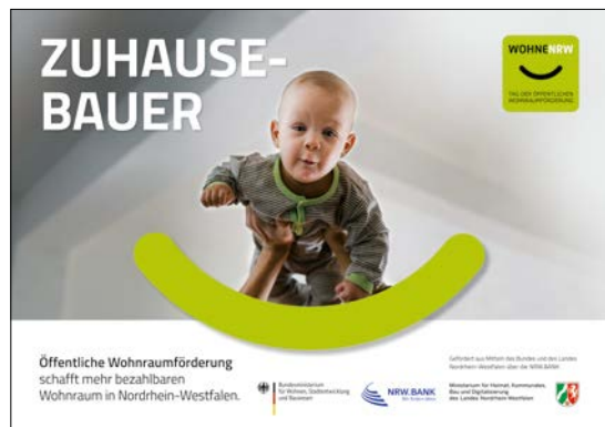
Mindestabbildungsgröße DIN-A2 (HxB): 420mm x 594mm plus Beschnittzugabe

Exklusives Hinweisschild (DIN-Format quer) mit den geforderten Inhalten