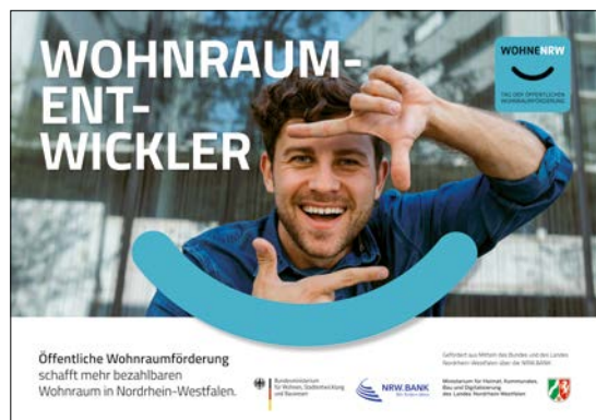
Mindestabbildungsgröße DIN-A2 (HxB): 420mm x 594mm plus Beschnittzugabe