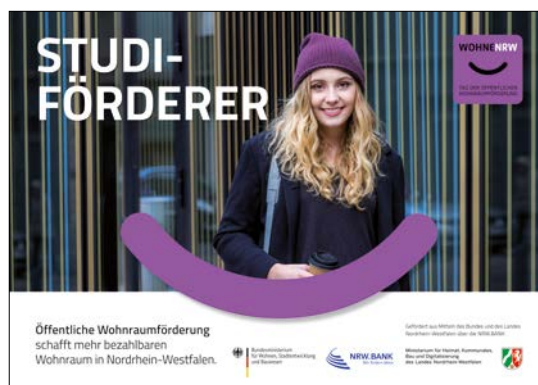
Mindestabbildungsgröße DIN-A2 (HxB): 420mm x 594mm plus Beschnittzugabe