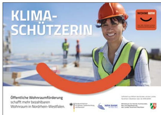
Mindestabbildungsgröße DIN-A2 (HxB): 420mm x 594mm plus Beschnittzugabe