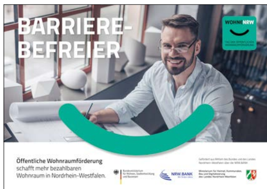
Mindestabbildungsgröße DIN-A2 (HxB): 420mm x 594mm plus Beschnittzugabe