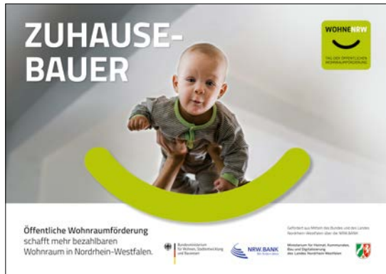
Mindestabbildungsgröße DIN-A2 (HxB): 420mm x 594mm plus Beschnittzugabe

Exklusives Hinweisschild (DIN-Format quer) mit den geforderten Inhalten