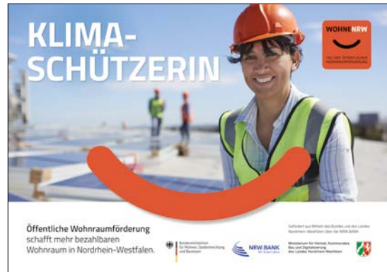
Mindestabbildungsgröße DIN-A2 (HxB): 420mm x 594mm plus Beschnittzugabe