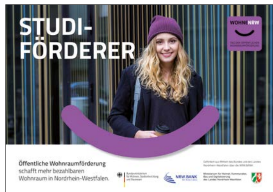
Mindestabbildungsgröße DIN-A2 (HxB): 420mm x 594mm plus Beschnittzugabe