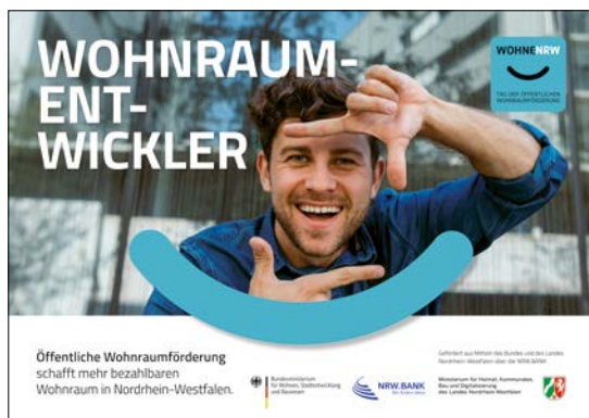
Mindestabbildungsgröße DIN-A2 (HxB): 420mm x 594mm plus Beschnittzugabe